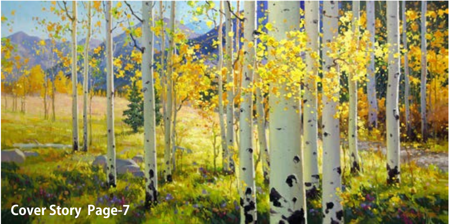
Cover Story Page-7