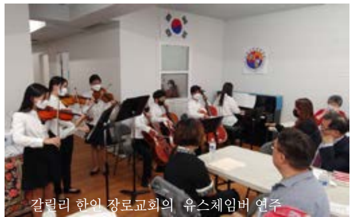
갈릴리 한인 장로교회의 유스체임버 연주