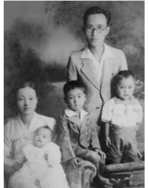
1941년 마산에서 찍은 가족사진

단순히 연 날리는 장면을 노래한 게 아니라 일본의 억압에서 해방된 나라의 기쁨을 노래한 동시인 것을 깨닫게 되었다. 한 시간 이상 동시 한편에 담긴 뜻을 설명하시는 것을 들으며 내가 깨달은 것은 아버지는 어린이들이 쉽게 이해할 수 있는 평범한 글 속에 어른들도 이해하기 쉽지 않은 깊은 뜻을