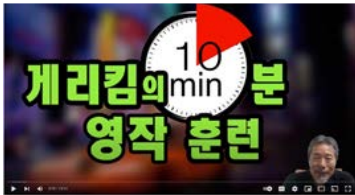
게리 킴의 유튜브 강의 영상 캡처