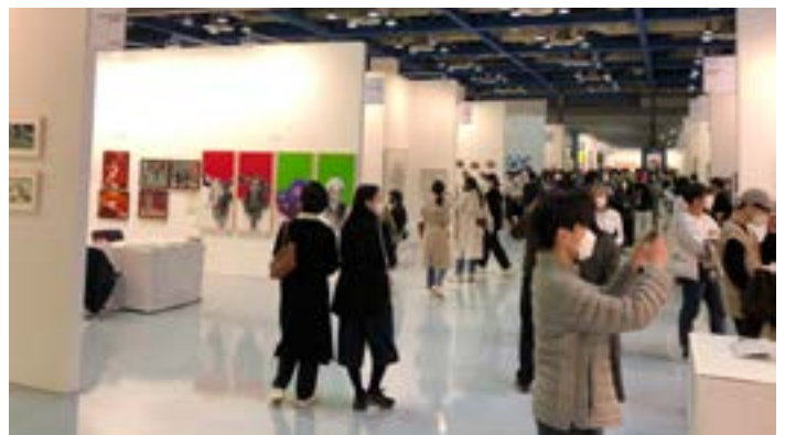
KIAF SEOUL 아트페어