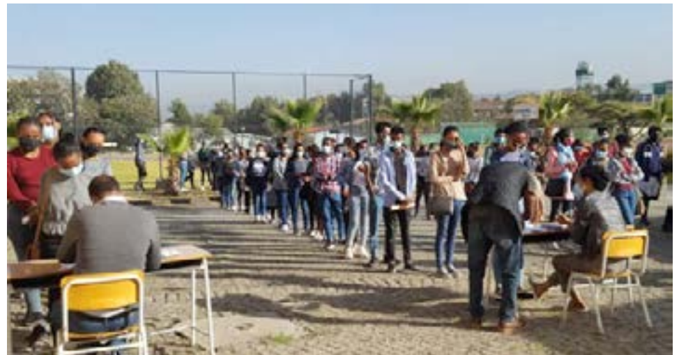
사진 #3: 입학 시험을 치르기 위해 학교앞에서 수험번호를 받기위해 줄을 서 있는 수험생들. 코로나로 입학시험이 6개월 지연되었고 45명 정원에 232 명이 지원했다.

저의 학장팀이 이룬 가장 큰 업적으로 코로나로 인한 여러 가지 어려움과 불편에도 불구하고 온 학생들과 교직원들이 한 공동체가 되어 일 할 수 있는 바탕을 닦아 놓을 수 있게 되었습니다. 이렇게 되기까지는 많은