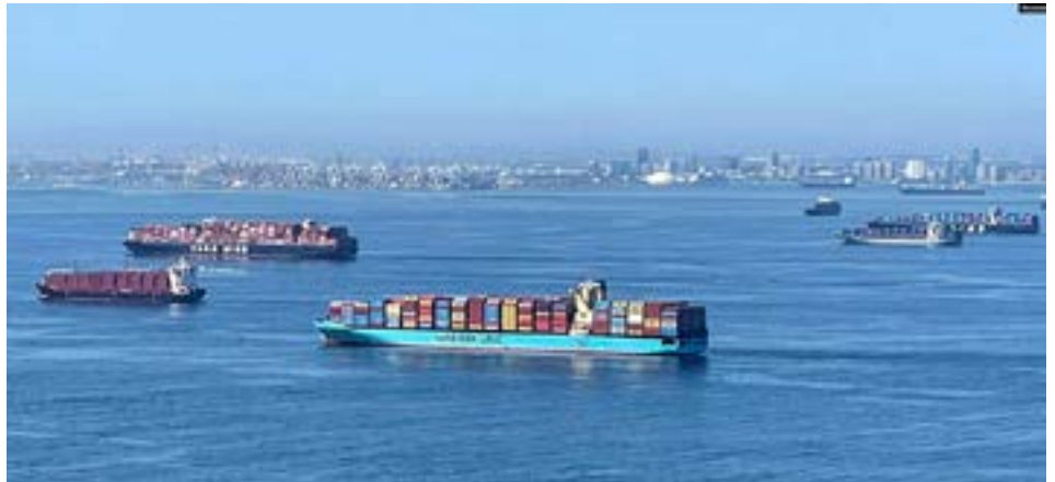
로스앤젤레스항과 롱비치항에 들어온 수십 척의 화물선이 입항하지 못한 채 며칠씩 앞바다에 적체돼 있다.

이런 물류대란이 벌어지고 있는 이유는 복합적인데요. 우선 전 세계적으로 백신 접종이 본격화하고 경제가 기지개를 켜면서 소비가 급증했지만 전 세계 공급망이 제대로 작동하지 않고 있기 때문입니다.