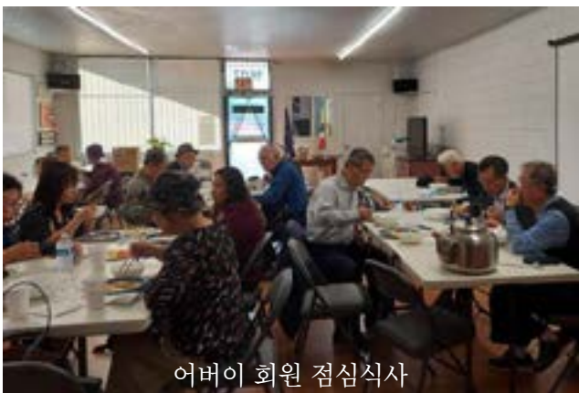
아버지 회원 점심식사