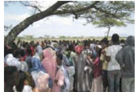
사진 #1: 2018년 8월 아디스아바바에서 3시간 떨어진 마을에 무의촌 진료를 따라 갔을 때 약 400명이 되는 "시골" 사람들이 진료를 받기위해 미리 기다리고 있는 모습

문을 닫는 상태가 되었습니다. 바로 이런 상황에서 제가 부름을 받아 학교를 재정립하고 코로나가 안정되면 곧 학교를 계속할 수 있도록 도와달라는 부탁을 받게 되었습니다. 처음에는 당황했지만 저희들은 하나님의 뜻이라는 것을 알고 주저하지 않고 떠날 준비를 했습니다. 연로하신 어머니 및 멀리 떨어져 살고 있는 자식들을 만나려고 계획했던 여행들을 모두 취소하고 아리조나에서