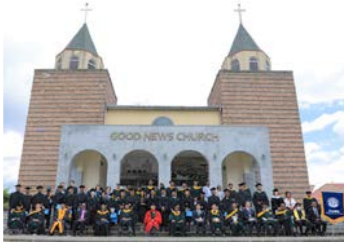
사진 #4: 코로나로 인한 여러가지 어려움속에서 23명의 졸업생들과 정부 교육기관의 지도자들과 아디스아바바의 주요 의과대학 학생들이 참석한 가운데 무사히 의과대학 졸업식을 치루게 되었다.

이번 선교 기간 중에 서울에서 홀로 사시는 어머님을 뵙기 위해서 서울을 방문할 기회가 있었습니다. 이 기회에 대학 동기동창들을 만나 보기로 했습니다. 8명의 동기중 4명은 중병으로