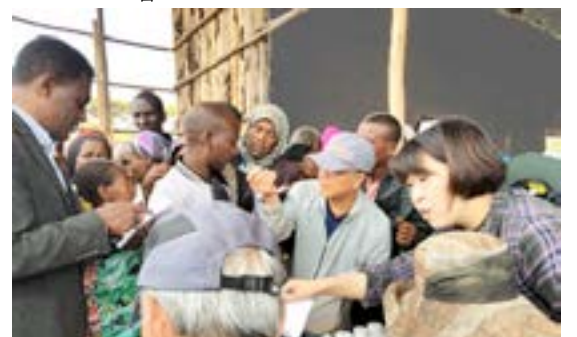
사진 #2: 당시에 건축중인 교회당에서 4명의 의사와 1명의 간호원과 1명의 약사 (본인) 와 2명의 보조원들이 현지인 통역들을 옆에 두고 환자들을 돌보아 주고 있는 모습