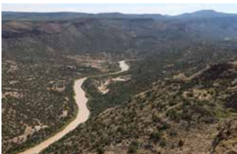
White Rocks 근처의 계곡을 흐르는 Rio Grande강

Montoso Peak 다리가 건설된다면 타오스 북쪽에 있는 관광명소 중 하나인 Rio Grande Gorge Bridge보다는 훨씬 높은 인기를 얻는 새로운 명소가 될 수도 있을 것이다. Montoso 다리의 길이는 2,790 피트로 계획되어 있고 Rio Grande Gorge Bridge 다리의 길이는 약 1,300 피트이다.