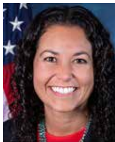
Rep. Xochitl Torres Small

뉴멕시코 이 지역을 대표하는 스몰(Xochitl Torres Small) 미 하원의원은 “우리는 그 개정안이 압도적인 지지로 통과할 것으로 본다”고 말했다. 이 개정안이 법안으로 통과되면 화이트 샌드는 국립공원으로 선포될 것이라고 말했다.