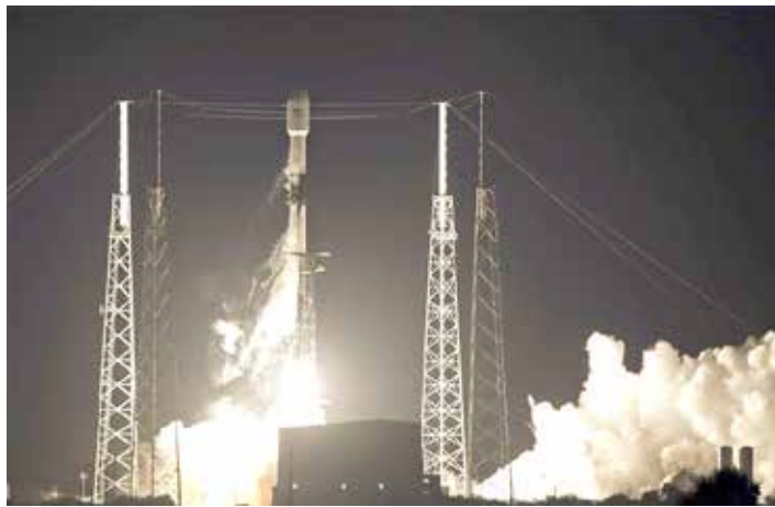
플로리다주 케이프커내버럴 공군기지서 스타링크 첫 위성 60기를 실은 '팰컨9' 로켓이 발사되고 있다.

일론 머스크가 이끄는 미국의 우주개발업체인 '스페이스X'는 지난 5월 플로리다주 케이프커내버럴 공군기지에서 첫 통신위성 60기를 실은 '팰컨9' 로켓을 쏘 올렸다. 스페이스X는 조만간 6 차례에 걸쳐 위성 60기씩 추가 발사하고, 이번에 쏘 올린 60기를 합친 420기로 시범 서비스를 시작할 예정이다. 스페이스X 측은 이르면 내년을 우주 인터넷 출범 시기로 잡고 있다.