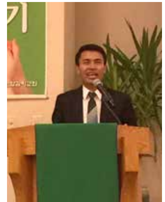
미얀마의 리안 목사

우리 교회는 이름은 한인 연합감리교회인데 언제부터인지 모르지만 한국인, 중국인, 흑인, 백인, 나바호 인디언, 미얀마인 등 여러 인종들이 모여 있는 교회가 되었습니다. 평신도 지도자 가운데에는 중국인 장로님, 중국인 권사님, 미국인 집사님 등 여러분이 있습니다. 재미있는 사실은 주일 예배 후에 식사시간이 되면 한국어, 영어, 일본어, 중국어 조금 등을 여기저기에서 들을 수 있습니다. 한국어를 하는 미국인 사모님, 일본어를 하는 미국인 루터교 목사님도