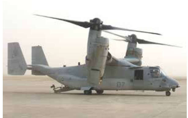
커트랜드 공군기지의 71특수작전비행대에 소속되어 있는 V-22 오스프리(Osprey)는 수직이착륙과 단거리 이착륙 능력을 가진 비행기이다.

공군 기지내에서 일하는 인력을 보면 샌디아국립연구소를합쳐서 볼때 군인과 민간인을 합쳐서 2만3천명의 인원이 일하고있다. ■