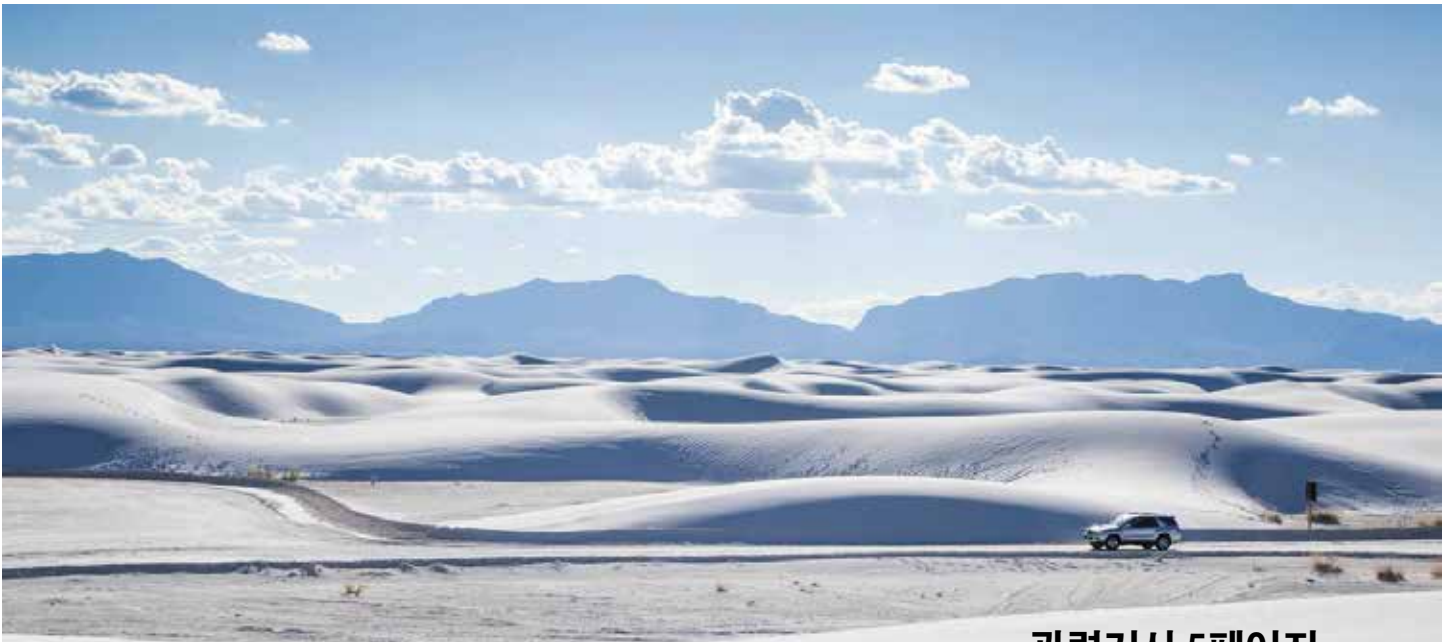
White Sands